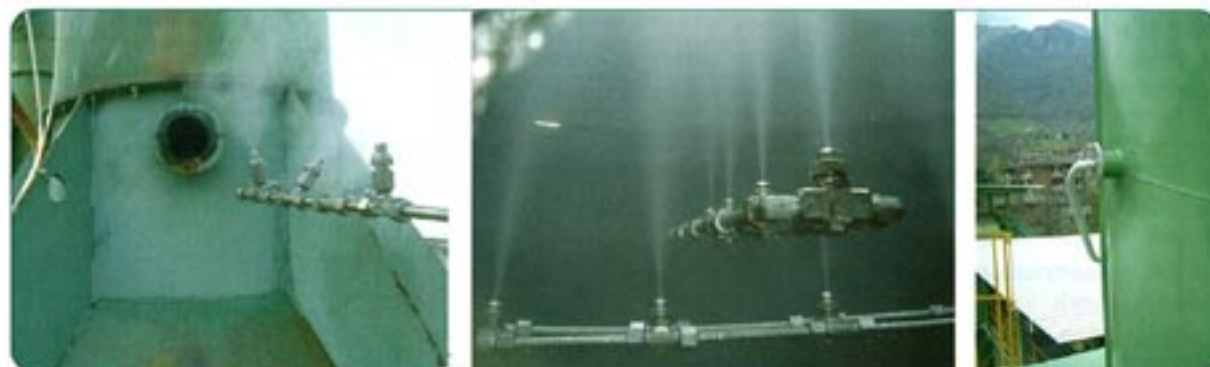
Fig. 1-2-3 - Esempio di installazione sistema di nebulizzazione.

Società appartenente al Gruppo Luci, LABIO TEST distribuisce in esclusiva sui mercati Europei ed Asiatici i prodotti della Società americana AiReactor INC., specializzata nel trattamento dell'aria e della neutralizzazione dei cattivi odori. In oltre 15 anni di esperienza, LABIO TEST ha perfezionato l'applicazione delle tecnologie proposte da AiReactor, realizzando inoltre una serie di solu-